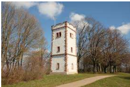
Aussichtsturm Hohe Flum